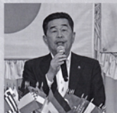
5月第1例会 東海市長 鈴木淳雄 様