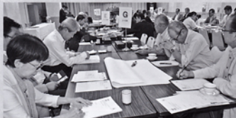
9月第2例会 ワークショップの様様