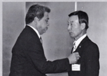
三役パッチ伝達式