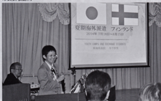
帰国報告会(例会場において)