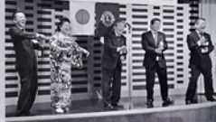
景気よく ウィーサー (今年もよろしく!)