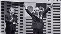
長寿祝 おめでとう