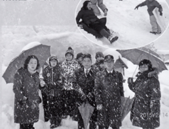
小野川温泉(宿泊場所)かまくら見学