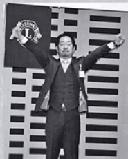
初老祝 おめでとう