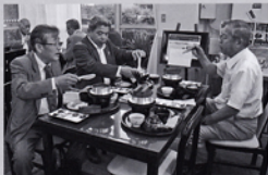
5月第2例会 夜間例会