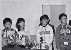
平洲小学校・明倫小学校児童