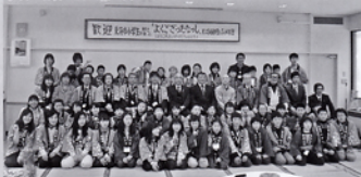
雪ん子少年団交流会