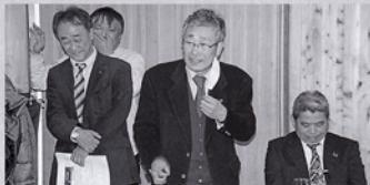
12月第2例会 クリスマス例会 なばなの里