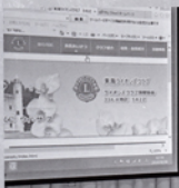
8月第1例会 ウェブデザイナー 水野真弓 様