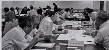
9月第2例会 ワークショップの模様