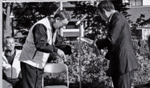
屋外ステージ 目録贈呈