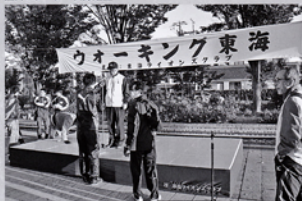
屋外ステージ(市へ贈呈)