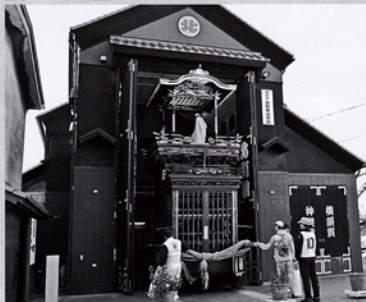
山車蔵 横須賀 北町