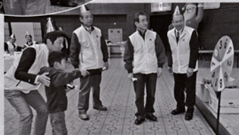
プレゼントゲット