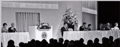
5月第1例会 334-A地区年次大会