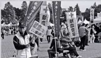
東海秋まつり会場にて