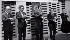
景気よく ウィンサーブ