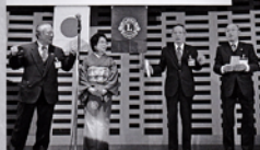
金婚式祝 おめでとう