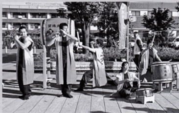
オープニング 櫻嶋太鼓