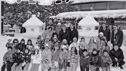
児童作製 雪灯ろう前