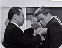
三役バッヂ伝達式