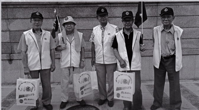
薬物乱用防止キャンペーン(ティッシュ配布)