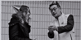
12月第2例会 YCE来日生歓迎会&amp;クリスマス例会