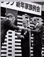
傘寿祝 おめでとう