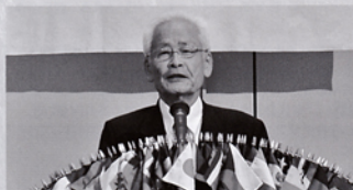
ガバナーL福田源公式訪問2Z合同例会