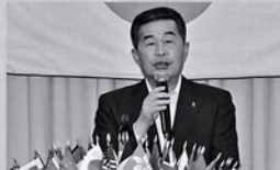
5月第2例会 東海市長 鈴木淳雄様