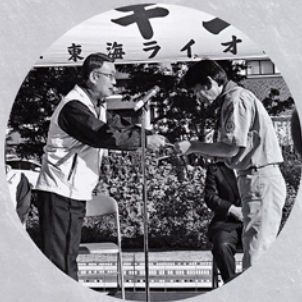
スカウト連絡会助成金贈呈