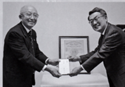
11月第1例会 CN記念特別例会